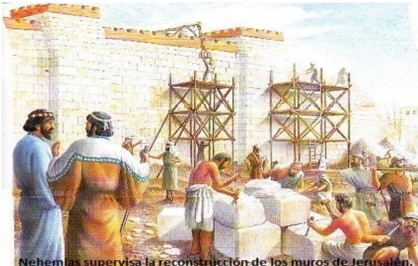
Nehemías supervisa la reconstrucción de los muros de Jerusalén.